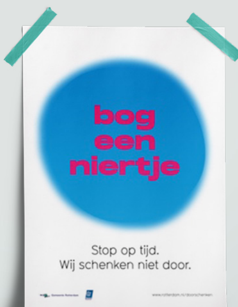
Beeldmateriaal uit de publiciteitscampagne die in Rotterdam Centrum is ingezet.