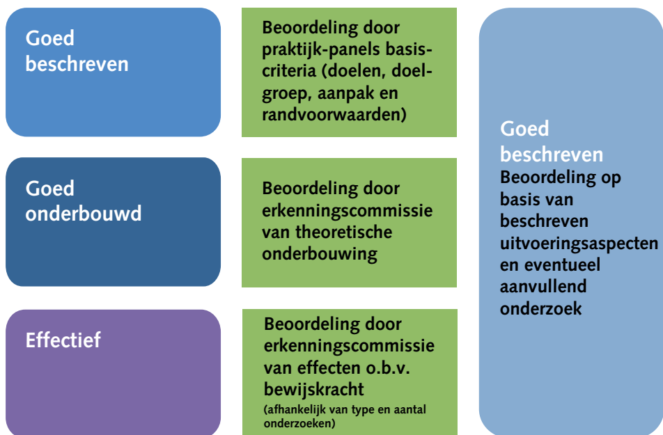
Schema 1. Niveaus van erkenning door de Erkenningscommissies van CGL en NJi (2014)

*Het niveau Effectief is onderverdeeld in de categorieën Eerste aanwijzingen voor effectiviteit, Goede aanwijzingen voor effectiviteit en Sterke aanwijzingen voor effectiviteit.