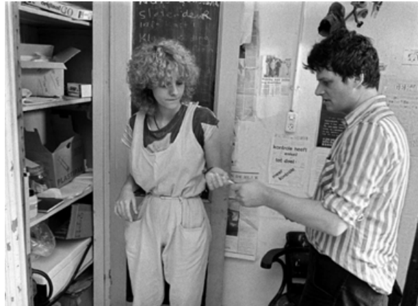
Foto: Medewerker van de MDHG met een cliënt bij de 'spuiten-kast'. - Harrie Timmermans, 1984

Het Nederlandse beleid van omgaan met mensen die overmatig middelen gebruiken of verslaafd zijn kent echter een langere geschiedenis. 7 Al aan het begin van de vorige eeuw (rond 1900) viel het degenen die werkten in de verslavingszorg al op dat mensen met alcoholproblemen ('drankzuchtigen') lastiger te genezen waren dan gehoopt. Ze vielen geregeld terug in gebruik en in die prille tijden van de Nederlandse verslavingszorg besloot men al pragmatisch te werk te gaan door de schade te beperken die de verslaving aanrichtte. Ze probeerden schulden aan te pakken en inkomen, werk, kleding en huisvesting te regelen voor de personen met een verslaving en hun gezinnen. Zij werden bijvoorbeeld in fatsoenlijke pensions en kosthuizen opgevangen, waar ook gelijk een oogje in het zeil gehouden werd.