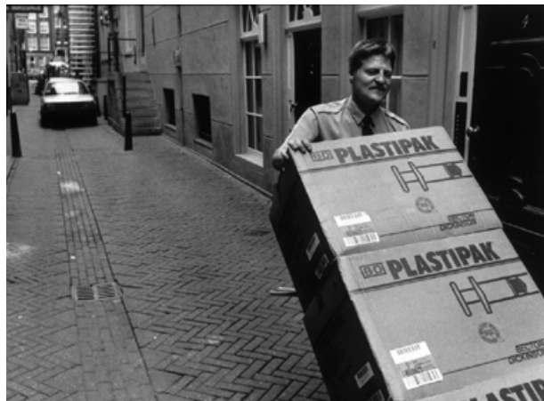
Foto: GGD-medewerker bezorgt schone spuiten in Amsterdam