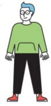
Coördinator Sport en Preventie