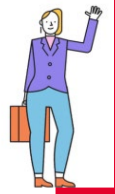
Beleidsmedewerker (o.a. Sport en Volksgezondheid)