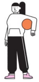
Clubkadercoach (vereniging- en sportparkmanager)