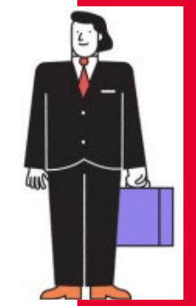
Commerciële aanbieders of ondernemers