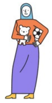
Sportorganisaties (Sportbedrijf of teamsportservice)