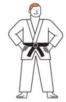
Sportverenigingen / sportaccommodaties