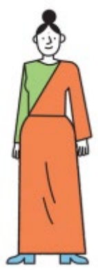
JOGG-coach gezonde locaties