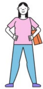
Adviseurs Lokale Sport