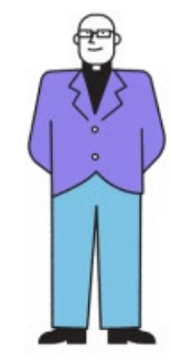
Buurtsportcoaches, cultuurcoaches of combinatiefunctie- nari s onderwijs