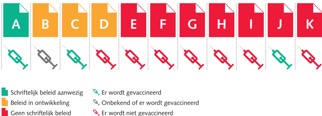
Aanwezigheid van schriftelijk beleid met betrekking tot de hepatitis B-vaccinatie in 2014

Opvallend was dat bij vier instellingen de respondenten niet bekend waren met het besluit van het Netwerk Verslavingszorg om intraveneus drugsgebruikende cliënten blijvend de vaccinatie tegen hepatitis B aan te bieden. Bij navraag bleken twee respondenten wel hiervan op de hoogte te zijn en van vijf instellingen is geen antwoord op deze aanvullende vraag ontvangen.