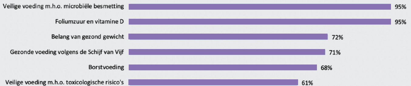
Figuur 3. Waar verwijzen verloskundigen naar door voor meer informatie over voeding?