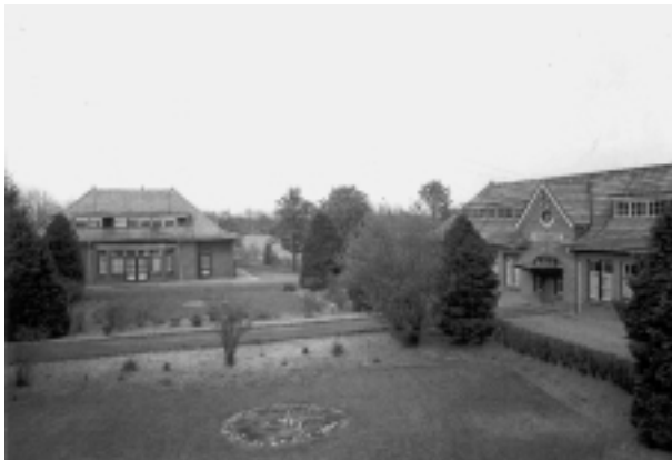
Paviljoen Oldenkotte, Rekken, rechts Achterbergs nieuwe verblijf. Collectie Museum De Scheper, Eibergen